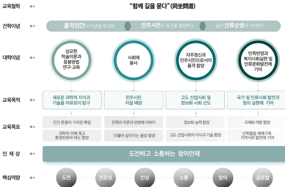
[대학의 건학이념, 교육목표 및 인재상 체계도]