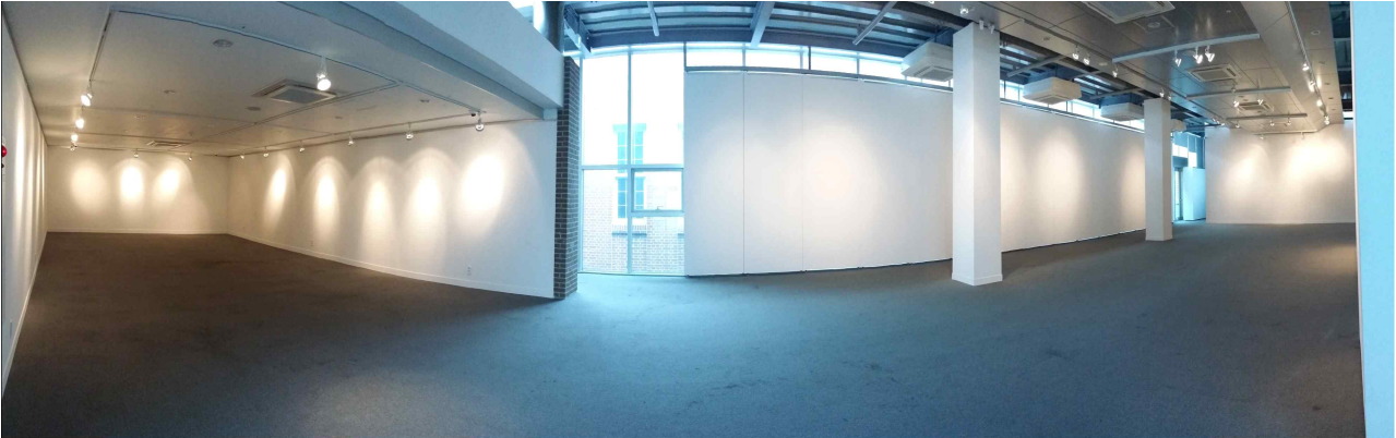
제 2전시실 (2층, 307㎡)

전시의 규모나 성격에 따라서 전시 공간을 자유자재로 연출할 수 있도록 파티션이 마련되어 있는 고품격 전시 공간입니다.