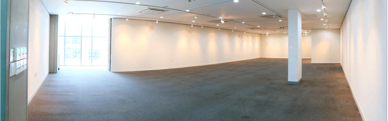
제 1전시실 (1층, 248.3㎡)